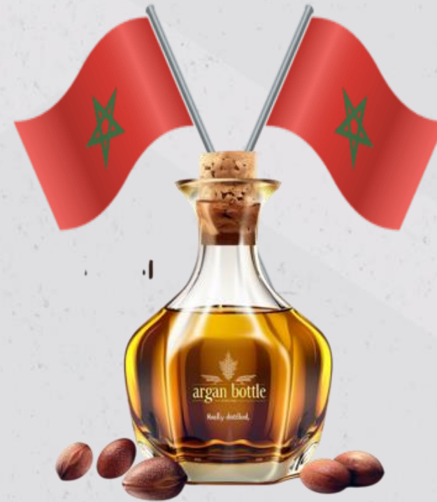
نجاح: (المغرب/ زيت الأركان)