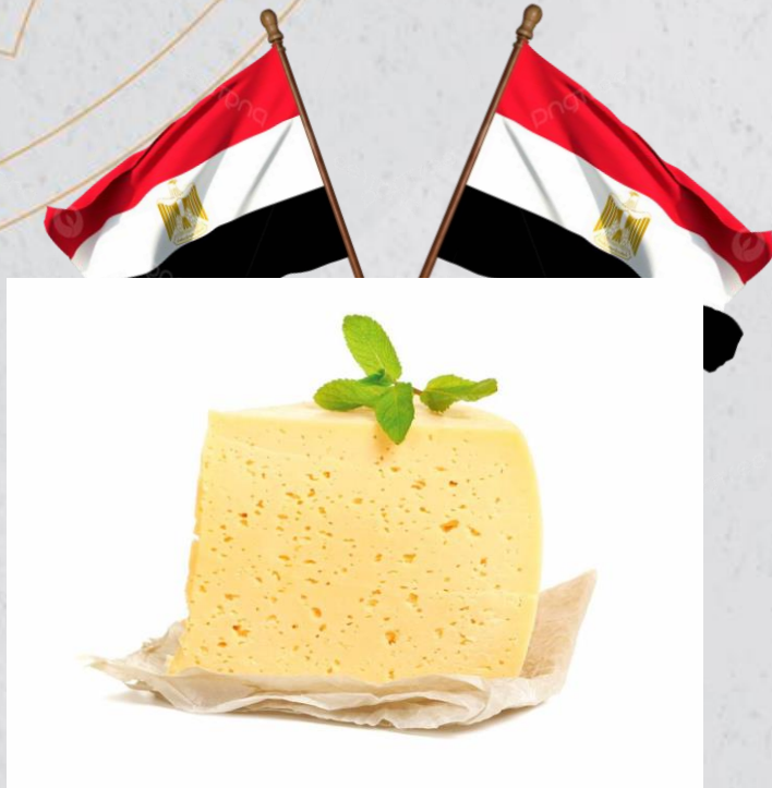
نجاح: (مصر/ بلبين)